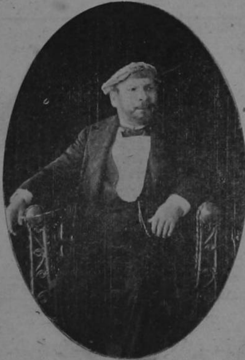
Homenaje al recordado limonense